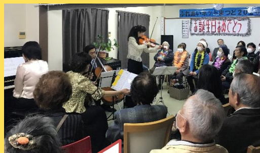
会場びっしりでの演奏会になりました。