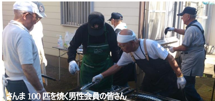
さんま 100 匹を焼く男性会員の皆さん

10月28日(水)、ふれあいの居場所みんなち恒例の会食会行事さんま祭りが開かれ、みんなちの利用者、ふれあいネットまつどの会員ら74人が参加しました。さんまを焼くのは男性会員、豚汁作りや配膳には女性会員・スタッフが活躍。参加した一人暮らしの高齢者は「みんなで一緒に食べるのはおいしいですね」と語っていました。コアラテレビの取材があり、夜のディリーニュースで放映されました。