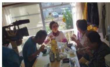
参加者は 11 時半と 13 時の 2 部制で炭火焼のさんまに舌つづみ。

10月28日(水)、ふれあいの居場所みんなち恒例の会食会行事さんま祭りが開かれ、みんなちの利用者、ふれあいネットまつどの会員ら74人が参加しました。さんまを焼くのは男性会員、豚汁作りや配膳には女性会員・スタッフが活躍。参加した一人暮らしの高齢者は「みんなで一緒に食べるのはおいしいですね」と語っていました。コアラテレビの取材があり、夜のディリーニュースで放映されました。