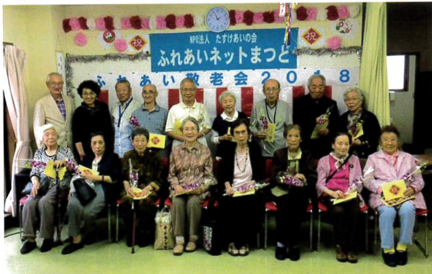
お花と記念品を片手に皆さんで記念撮影! みなさん素敵な表情です

今年で8回目となるふれあいネットまつどの敬老会! 今年は金ヶ作に移転してから初めての敬老会であり、会場を小金市民センターではなく、初めての試みとなるふれあいの居場所「みんなんち」で行いました。今回の敬老会では対象年齢の変更等もありましたが、100名以上の方にご招待状をお送りさせていただき、13名の敬老の方々、そして29名のお祝いをしたいという方々にご参加いただきました。