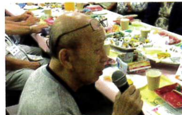
敬老の皆さまからも一言ずついただきました。皆さん若々しいです。