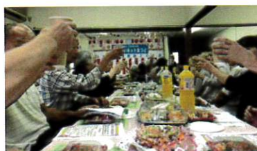
中実行委員長の乾杯の合図で和やかにスタートしました。