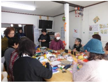
北小金時代のみんなんちでの折り紙教室。大人気で午前・午後の2部制に。(写真は2014年頃)