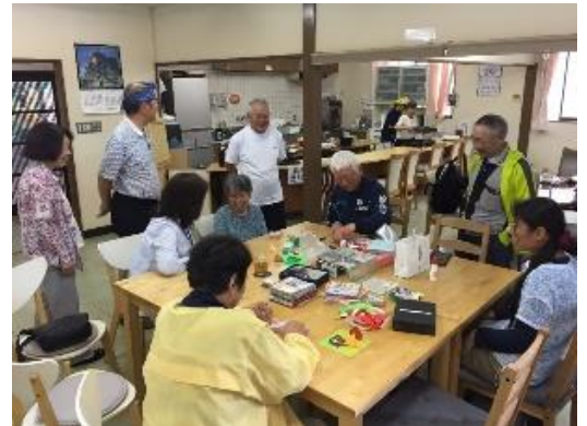
2018年金ケ作移転後の折り紙教室(右から3番目)