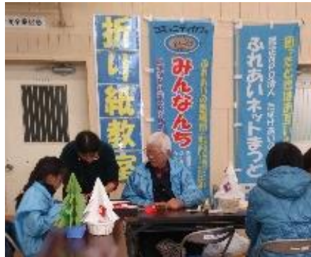
社会福祉協議会主催のふれあい広場での折り紙教室の様子(写真は2015年)