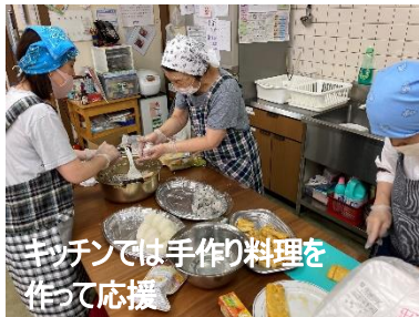
キッチンでは手作り料理を作って応援

今年も「やきそばプラザーズ」の一番！新しい仲間も入って、和気あいあいと取り組みました。