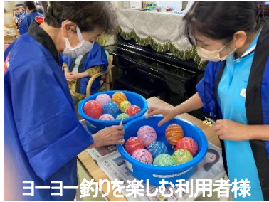
ヨーヨー釣りを楽しむ利用者様

デイサービスるんるんでは去年に引きつぎるんるん夏祭りを開催。屋外の「やきそばプラザーズ」の手作りやきそばや屋台メニューでバイキング。午後は恒例の盆踊りを楽しみました。