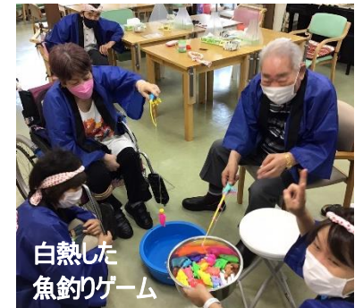
白熱した魚釣りゲーム