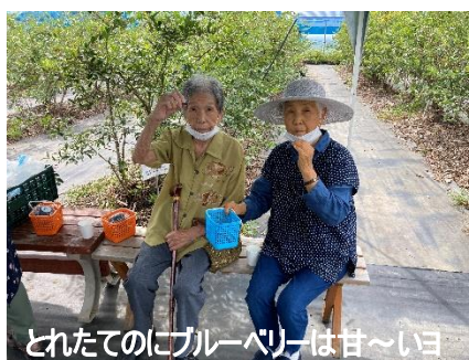
とれたてのにブルーベリーは甘～いヨ