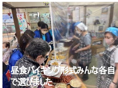
昼食バイキング形式みんな各自で選びました