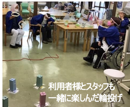
利用者様とスタッフも一緒に楽しんだ輪投げ

土曜日の言花グループの夏祭りは平日と同様に屋台メニューのバイキング。その後スタッフとともにゲーム大会をしました。