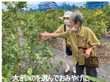
大きいのを選んでおみやげに