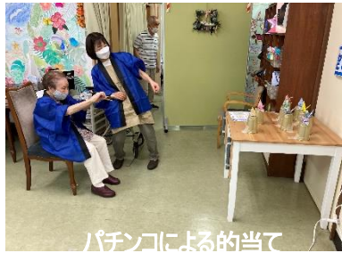
パチンコによる的当て