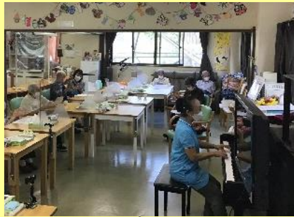
楽器を使っの“ピアノで歌おう”は大盛り上がり。盛り上げボランティアも大募集