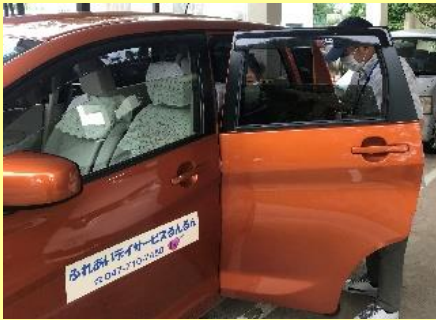
ボランティアさんの運転による送迎で今日も一日るんるんな気分。