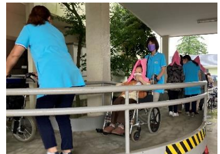
一人一人にスタッフが寄り添い誘導

9月8日(水)震度6の地震発生。厨房からの出火を想定した避難訓練をスタッフ・利用者を交えて実施しました。当日は9名の利用者様が参加。スタッフの声掛け・避難誘導の下、屋外に全員無事に退避することが出来ました。定期的に訓練を行い、万が一に備えていきます。