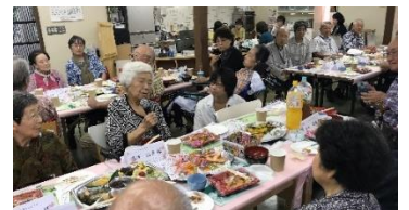
(右下) 長寿会員の一人一人の自己紹介にも味があります。(2018年)