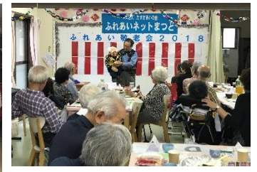
(右上) 協力会員の特技を披露(2018年)