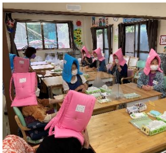
防災頭巾を着用し、地震から回避

9月8日(水)震度6の地震発生。厨房からの出火を想定した避難訓練をスタッフ・利用者を交えて実施しました。当日は9名の利用者様が参加。スタッフの声掛け・避難誘導の下、屋外に全員無事に退避することが出来ました。定期的に訓練を行い、万が一に備えていきます。