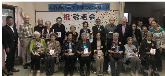
敬老会には20名近くの長寿会員が参加します。(2019年)

ふれあいネットまつどの「敬老会」は会員対象に皆様に集まってお楽しみ会とお祝いをしており、毎年お元気な皆さんとお会いできる楽しみな場でもあります。来年はぜひ開催したいと期待しています。