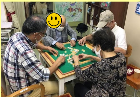
ボランティアさんの協力で囲碁とマージャンを毎週楽しんでいただいています。