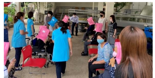
屋外避難場所で安否確認！全員います～