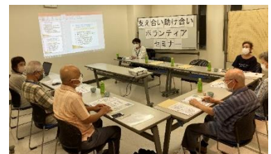
9月19日(日)市民劇場には4名が参加！

市民劇場・市民センターなどを会場にボランティア説明会を9月は毎週開催。役員の皆さんが各回に参加し、ボランティアをはじめたきっかけなどを話し、参加者と意見交換も行いました。