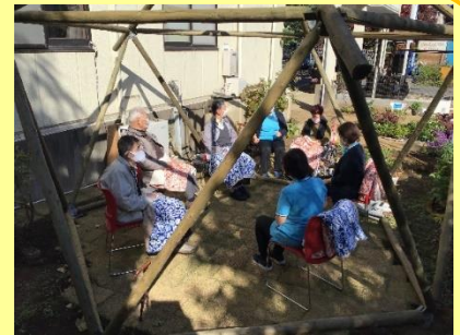
お外で一緒におしゃべり

ふれあいデイサービスるんるんは、一日の利用者が15名の時があり賑やかに過ごしています。るんるんの活動には介護スタッフ・調理スタッフ・機能訓練指導員・ドライバーの他にも多彩なボランティアが関わって下さっています。るんるんを盛り上げて頂けるボランティアを募集しています。