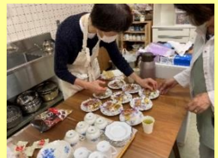
15時のおやつも手作り!