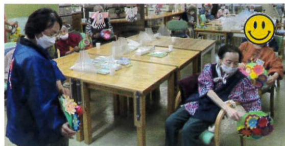
手作り花笠で花笠音頭を踊ったよ!