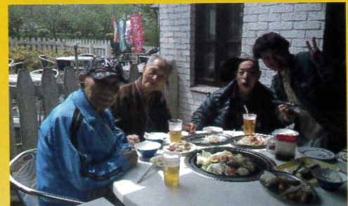
お昼はバーベキューを楽しみました。