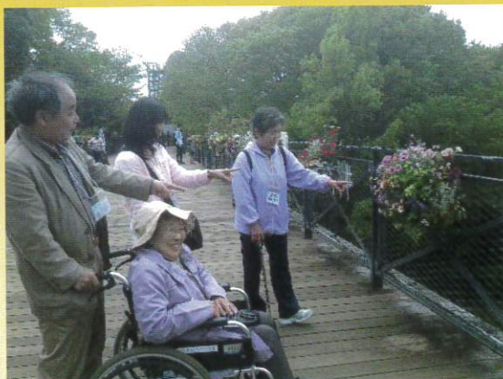
グループに分かれての散策です。