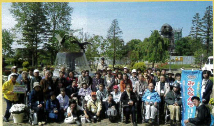
この年は風車が工事中。バス2台で行きました。