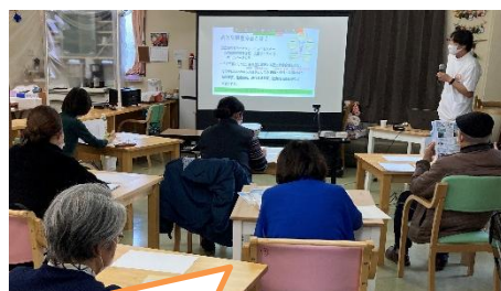
研修会では動画視聴しました。