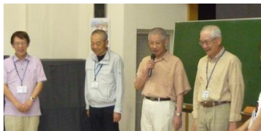
6/19(日)移動支援フォローアップ研修