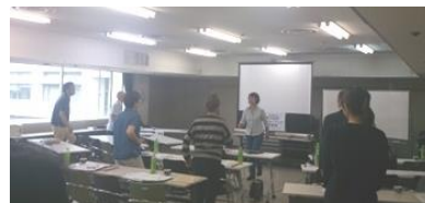
7/9(土)生活支援・サロンフォローアップ研修