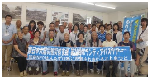
旧野蒜駅舎にはファミリーマート、震災の写真を展示する交流センターが入っている

みんなんち・黄色いハンカチ「AED設置募金」にご協力ください！ 2016年8月1日～9月30日