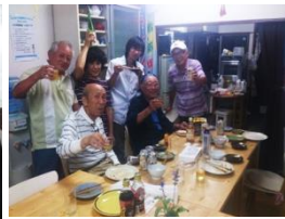
7/22 みんなんち居酒屋オープン、8月は暑気払いも開催予定