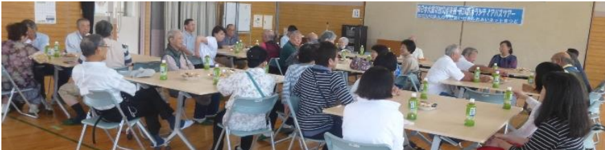
被災地を巡った後、被災者のみなさんとの懇談会(宮城県東松島市牛網公民館)