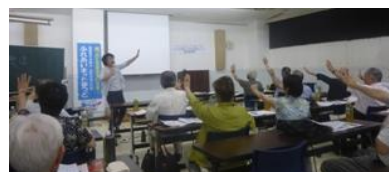
7/24(日)生活支援実務研修会