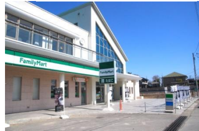
2016年7月16日訪問時の旧野蒜駅の外観