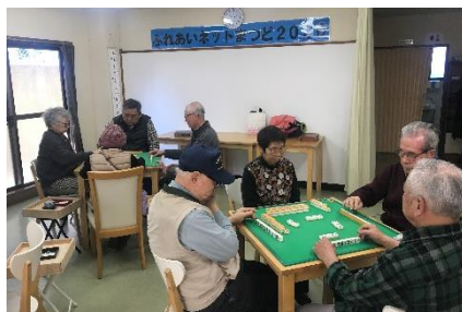
毎週木曜日開催の健康マージャン