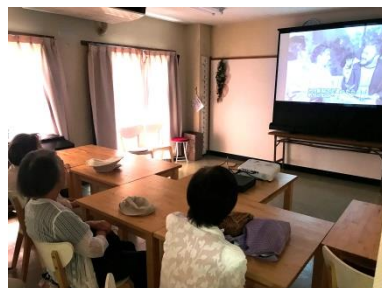
懐かしい内容の映画鑑賞会

ふれあいの居場所「みんなんち」は 5 月からは火曜日、木曜日にオープンします(金曜日の一部開催あり)。健康マージャンや折り紙教室・手芸などの従来の講座にプラスして、スマートフォン講座や大正琴で歌おうなど午前・午後と楽しい催しになります。詳しい日程は次回のニュースで。ぜひ、ご参加お待ちしております。